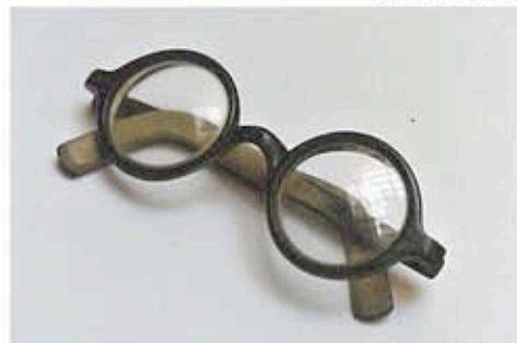
ル・コルビュジエが愛用した眼鏡