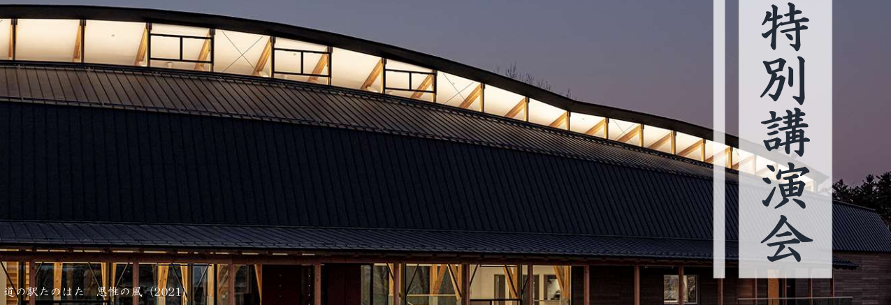
道の駅たのはた 思惟の風 (2021)